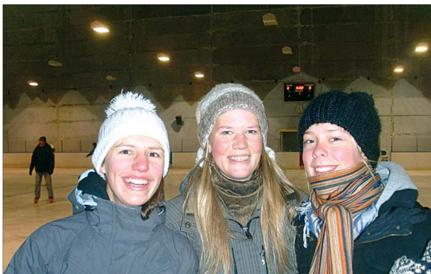
Jõulupidu Jeti jäähallis