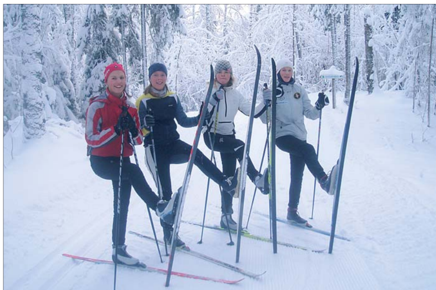
Tüdrukud Kekkose rajal