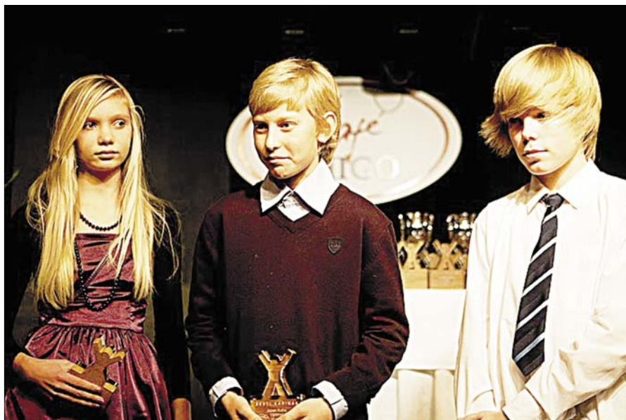
Hooaja lõpetamine, klass Optimist.