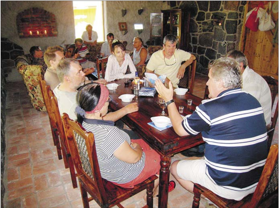
Kokkusaamine Kapteni kõrtsis. Juuli 2010.