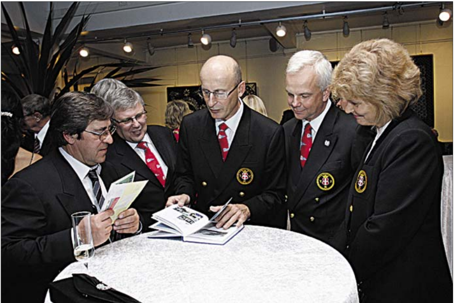
Suurt huvi pakkus raamat „100 aastat Tallinna Jahtklubi“.