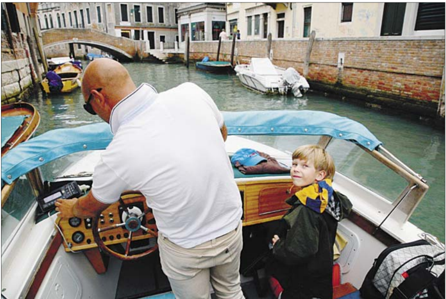
Veetakso on nagu takso ikka ja mõistagi taksomeetriga.