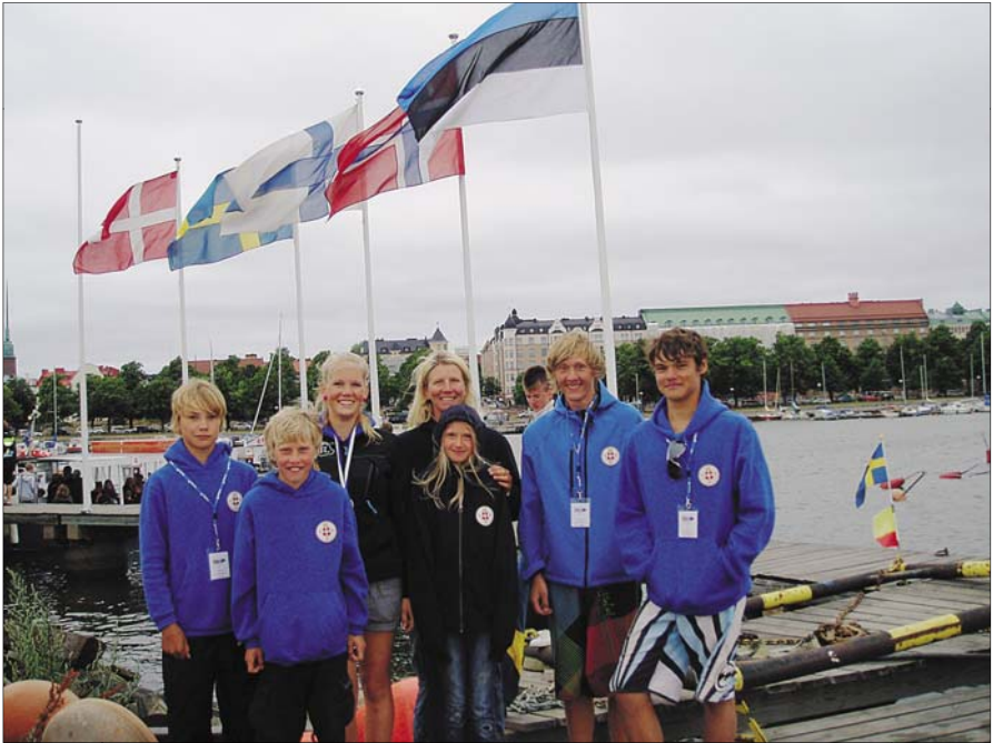
Põhjamaade meistrivõistlused Helsingis.