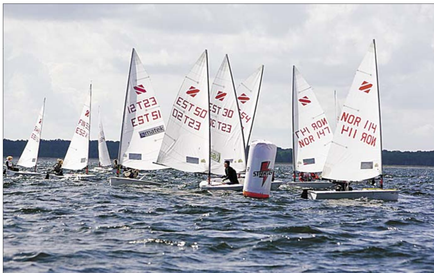
Zoom8 MM, Lohusalu.