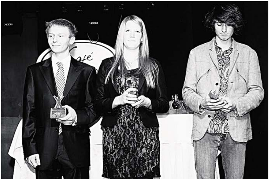
Hooaja lõpetamine, klass Laser Radial.