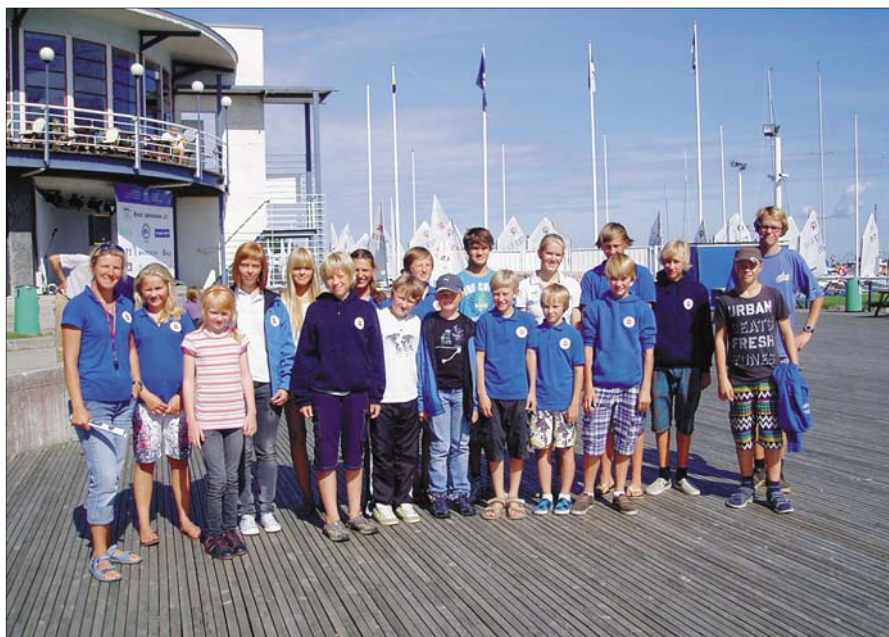
TYK Karikavõistlus, Lohusalu.