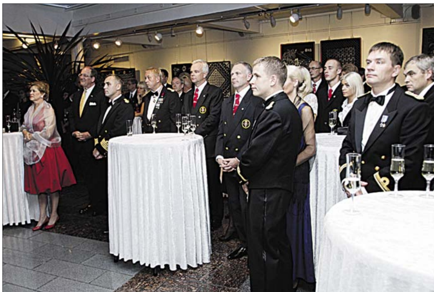
Osavõtjad kuulavad kommodoori peakõnet.