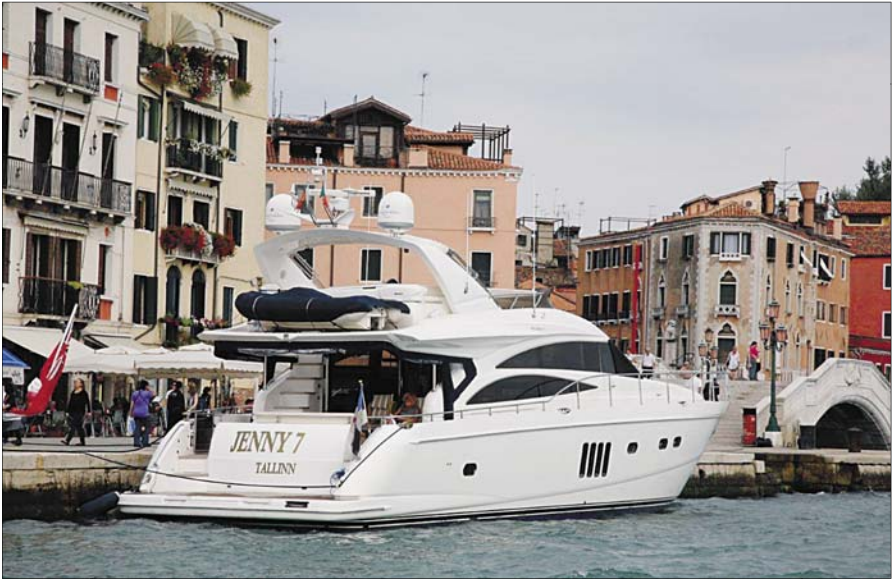
Jenny VII on kinnitanud otsad Veneetsia vanalinnas, mitte kaugel Püha Markuse väljakust.