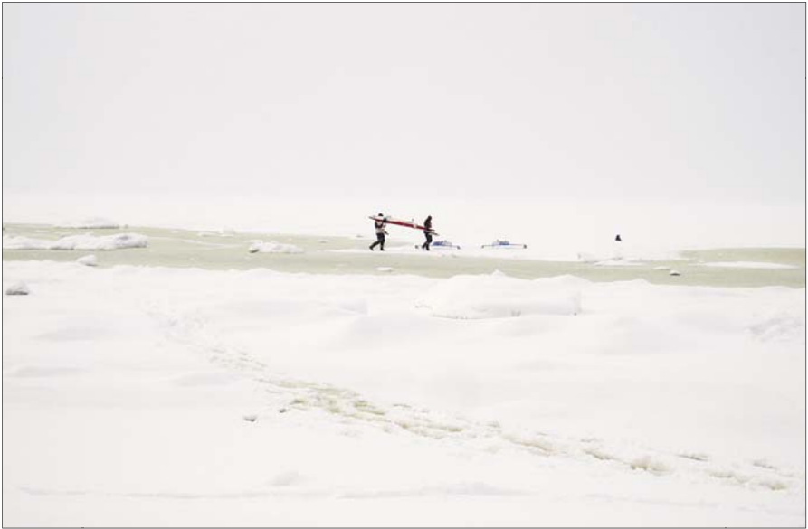
Teel merele, Valkla.