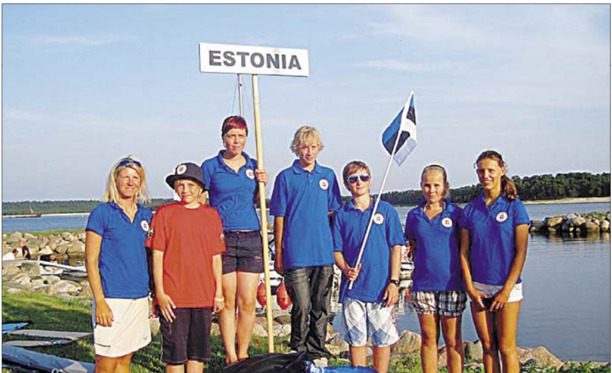
Zoom8 MM, Lohusalu.